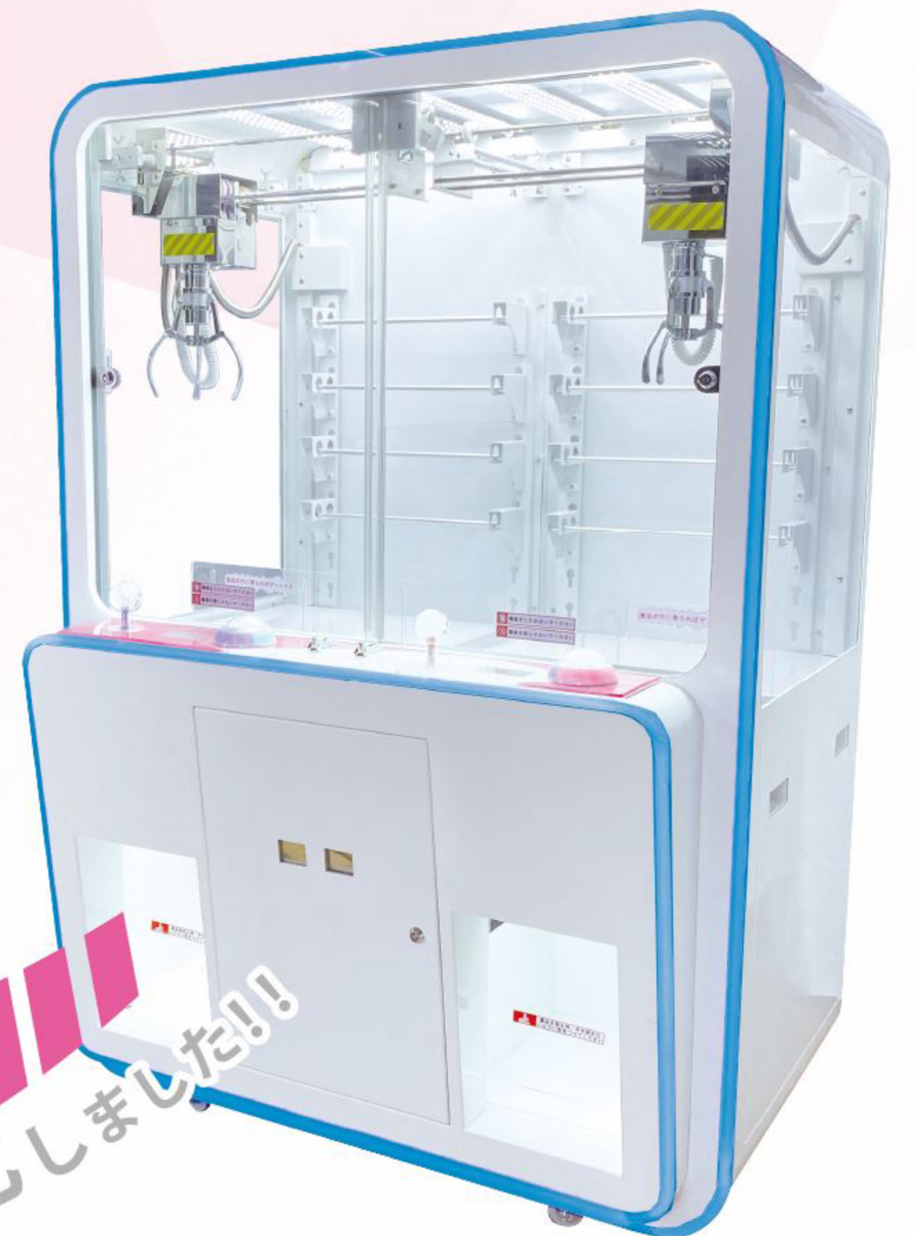
トリプルクレーン ドルチェ